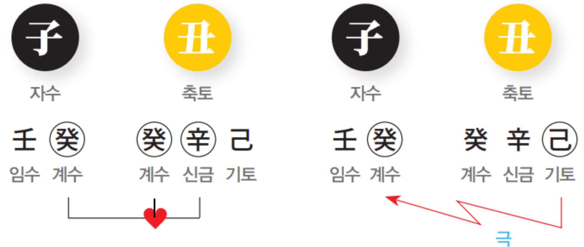
수 기운의 강화